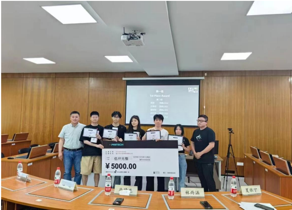
图 2 企业为竞赛优秀学生颁奖