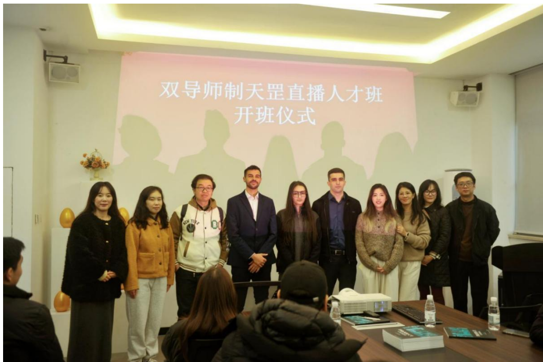
图 5 双导师制开班仪式

研究成果、教学设计与行业需求相结合，将产业最新趋势纳入课程体系中，为企业提供可持续的人才储备和理论参考。