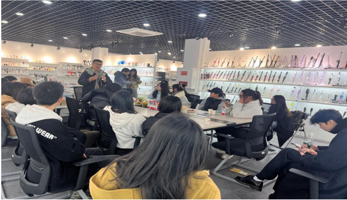
图 4 企业导师授课