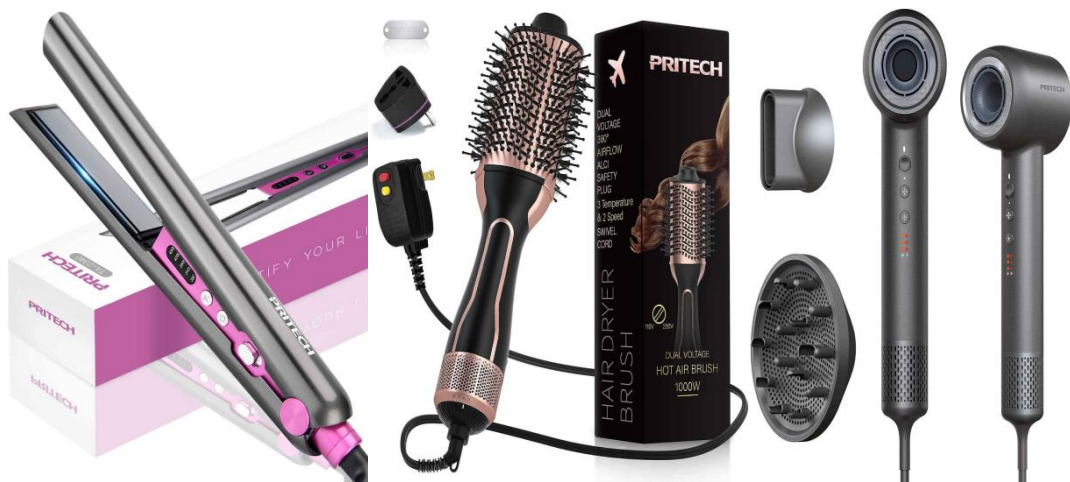
图 3 企业投入的产品