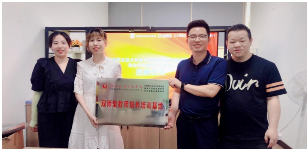
图 5：双师型教师培养培训基地授牌仪式

产教融合是培养“双师型”金教师的必由之路。依托校企共建的“双师型教师”培养培训基地，针对双师队伍建设，校企双方联合培养，推动专业教师下企业和企业导师进校园。