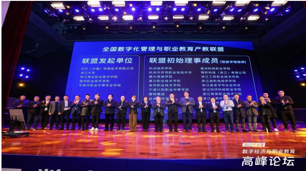
图 4：数字经济与职业教育高峰论坛现场

数字经贸学院与钉钉以及励臣进行深度校企合作，深入探索产业需求，加强专业内涵建设，以数字化管理师、数字营销师的培养为立足点，实时获取行业动态、技术发展及人才需求，制定产业人才需求分析报告，校企双方共同完成专业人才培养方案优化工作。依据社会需求来制定专业的教学标准、课程标准、岗位标准及实施方案，对原有专业教学进行合理调整，增加《企业数字化管理》课程，进一步完善实践课程体系，实现校企一体化育人。