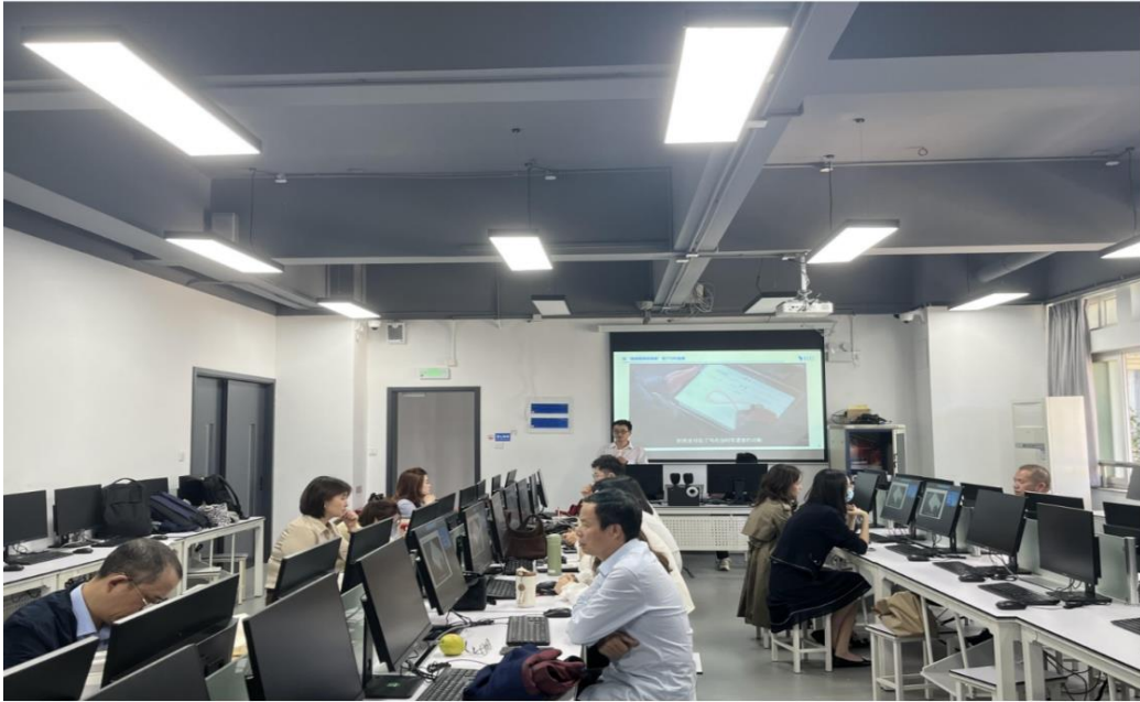
图6：励臣为市场营销教师提供数字化和低代码技能培训

术、新工艺和新规范。2023年11月1日，励臣的技术专家还为数字经贸学院市场营销专业15名教师提供了数字化和低代码技能培训服务。目前学院已有多位教师考取了数字化管理师和低代码师的证书。