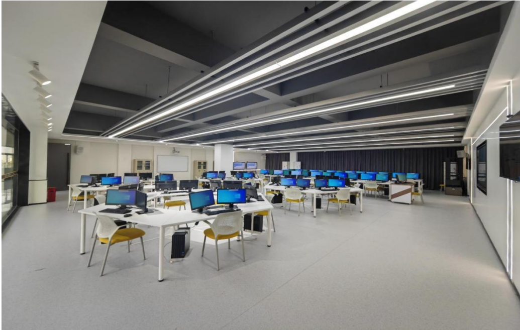
图7：数字化财务与管理实训室（力行楼506）

合作企业参与了数字经贸学院“数字化财务与管理实训室”的改造与建设。励臣为校内实训基地的建设提供了建设思路并进行了教学硬（软）件的捐赠，捐赠总额为51万元，提升了数字经贸学院的教学、实训水平。