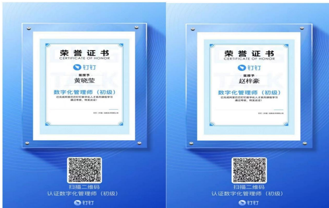
图 3：学生考取的数字化管理师证书