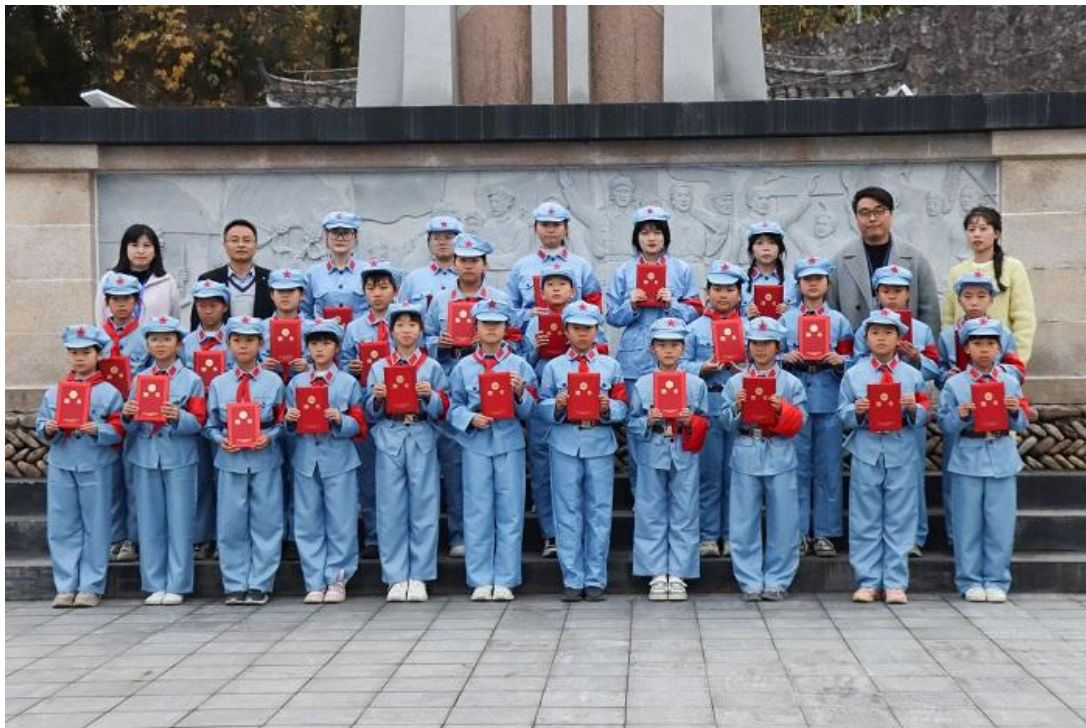
图2 “星星之火 汇光成炬”第二期红色小小解说员培育计划结对仪式

2023年，今年旅游业开始了强劲复苏，公司也得以与学校开展了更深度合作，取得了一系列成绩，助力永嘉文旅产业高质量发展。在人才供给方面，专业师生参与县域文旅各类交流活动10余次，高校师生优秀的精神面貌和良好的业务水平有效助力全国“千万工程”现场会、楠溪江音乐节等各项大型文旅活动顺利开展，由学校牵头实施的“星星之火 汇光成炬”红色小小解说员培育计划，累计培养50余名红色小小解说员，帮助永嘉红色血脉得以传承。